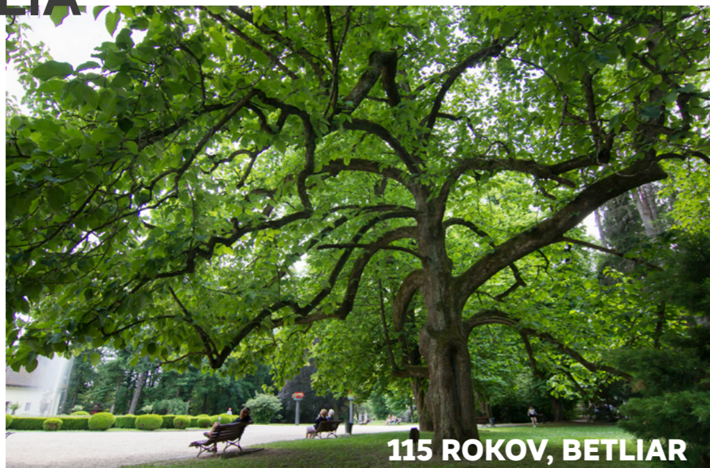
115 ROKOV, BETLIAR

V poradí už štvrtý rok bude prebiehať aj súťaž v hlasovaní medzi školami. Prvé tri školy, ktoré vyzbierajú najviac hlasovacích lístkov, získajú výsadbový materiál od Záhradníctva ABIES v celkovej hodnote 500 eur.