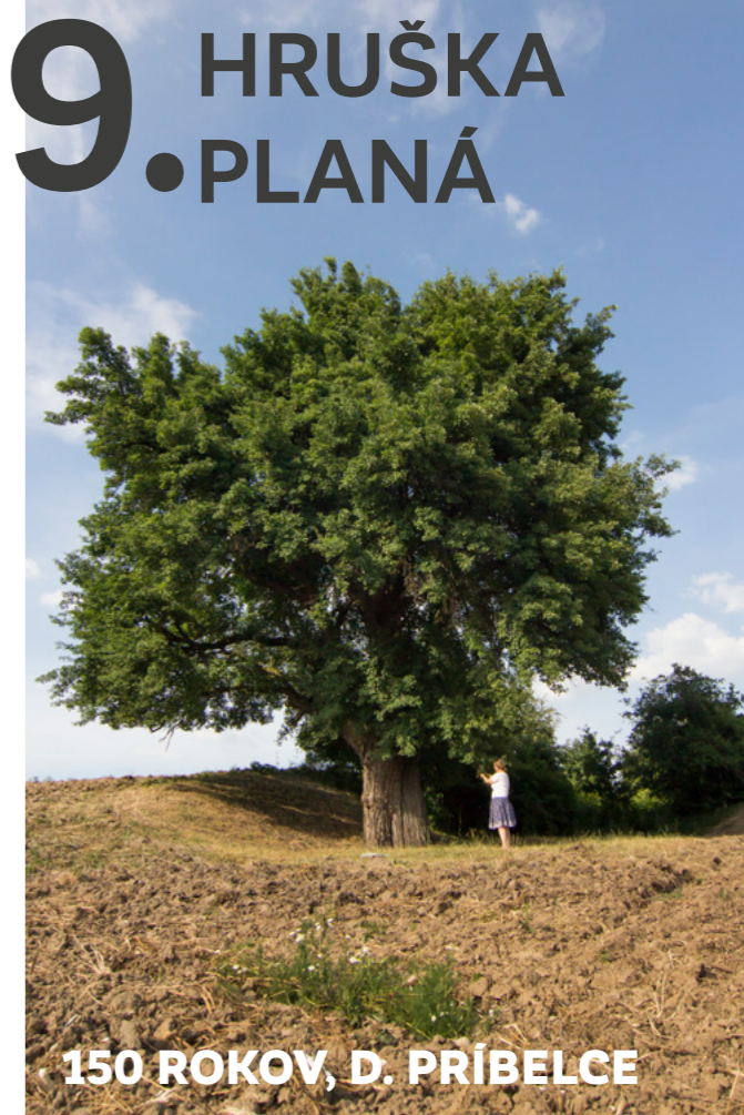
150 ROKOV, D. PRÍBELCE