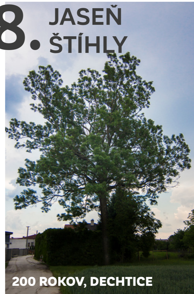
200 ROKOV, DECHTICE