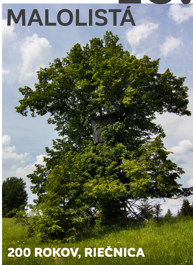
200 ROKOV, RIEČNICA