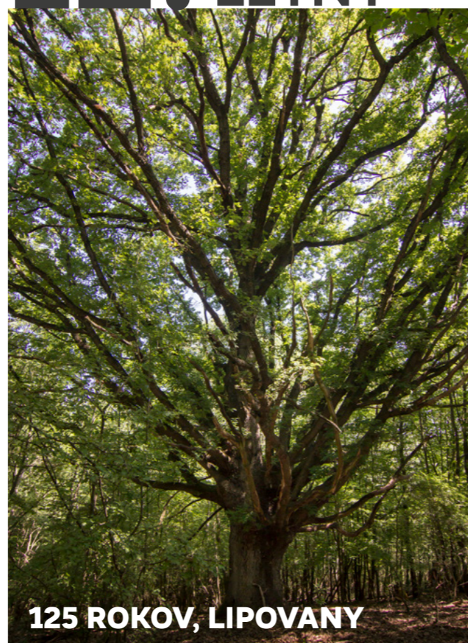
125 ROKOV, LIPOVANY