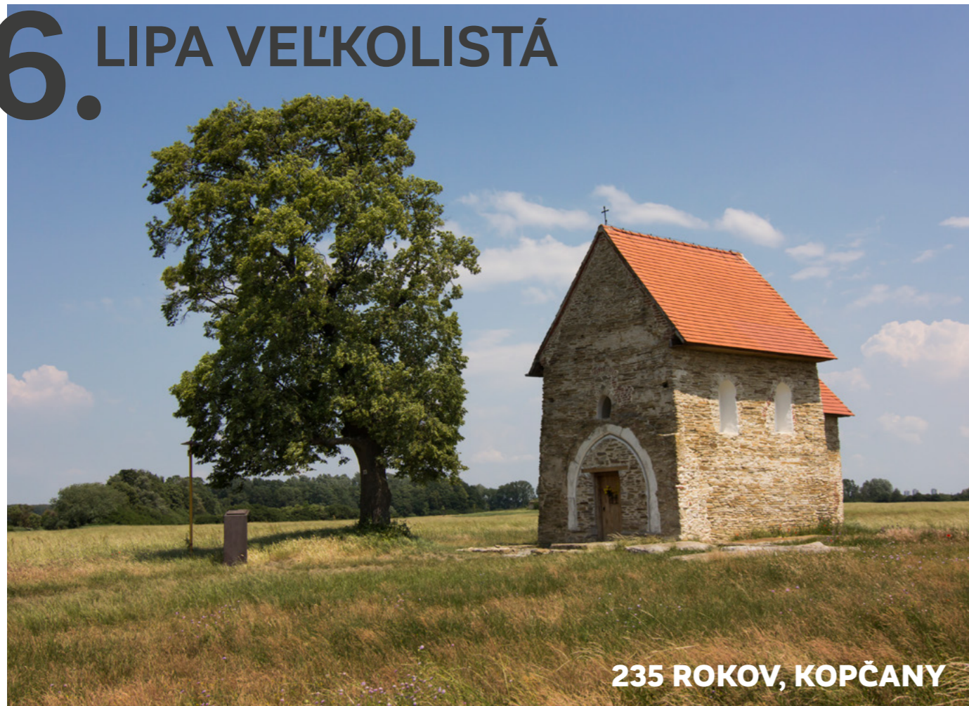
235 ROKOV, KOPČANY