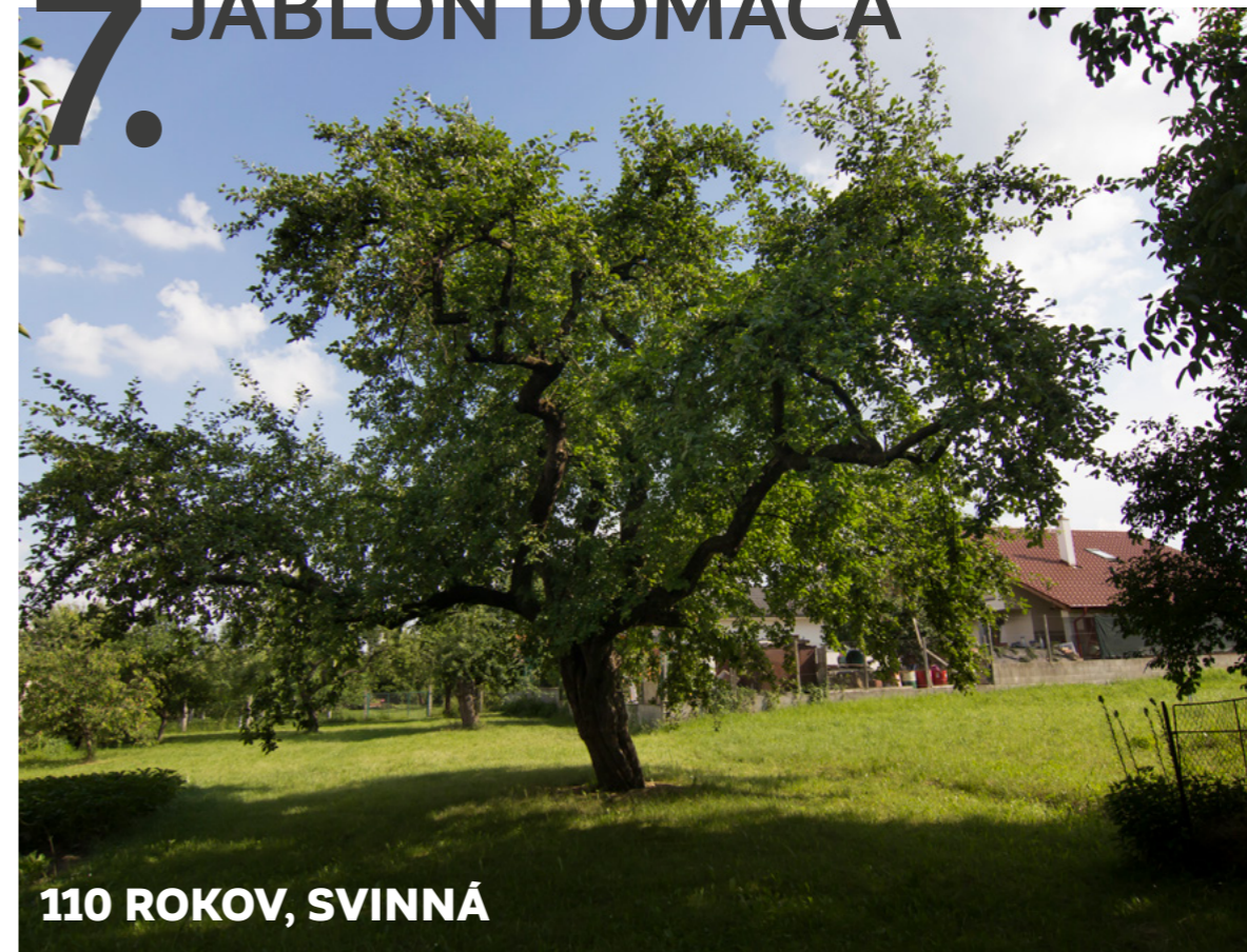
110 ROKOV, SVINNÁ